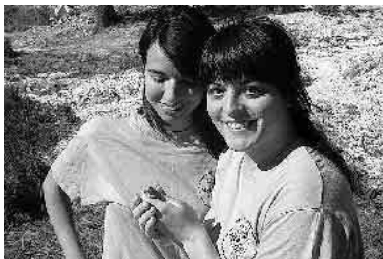
VOLUNTARIAS. Reconocimiento de especies. / UA

Fue fundamental la colaboración de unos cincuenta voluntarios. Además, hay que destacar que han sido incluidos por la Conselleria dentro del proyecto LIFE de Restauración de habitats prioritarios para los anfibios .